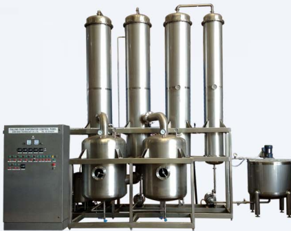
Falling Film Evaporator

โดยเครื่อง Spray Dryer และ Falling Film Evaporator